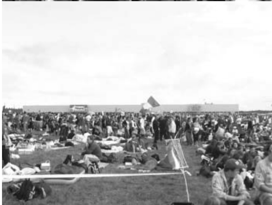
A pagina sei, la Cattedrale di Colonia; a pagina cinque, il campo di concentramento di Dachau, la festa di Italiani e la spianata di Marenfeld.

quanto appreso, con un occhio rivolto al 2008, quando i giovani di tutto il mondo si incontreranno in mezzo a canguri e koala, a Sidney, in Australia.