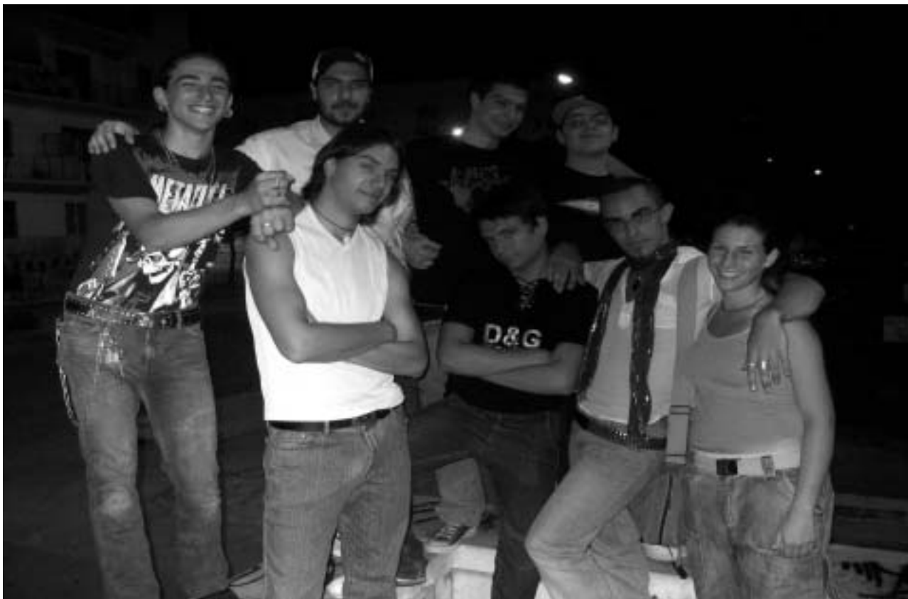
Nella foto, un gruppo di ragazzi di Foggia intervistati durante l'indagine

Varie le situazioni e gli stili riscontrati... Una griglia di osservazione ha raccolto informazioni relative alla composizione sessuale, all'età, al numero, alla posizione, alla mobilità, al linguaggio, al look, agli interessi, alle attività, ai bisogni e al rapporto con le parrocchie dei vari gruppi. Innanzitutto vanno sottolineati alcuni fattori fondamentali: la risposta dei ragazzi incontrati è stata, oltre tutte le aspettative e i timori degli operatori, entusiasta e gioiosa. Tranne rari casi di chiusura e rifiuto, l'approccio dell'ascolto e dell'accoglienza gratuita è stata la chiave giusta per rompere il ghiaccio della diffidenza e stimolare la curiosità sul perché e sugli sviluppi del nostro intervento. Il fatto poi di invitarli a fare una semplice foto di gruppo per realizzare una mostra fotografica ai quali sarebbero stati chiamati a prendere parte ha attivato un altro importante fattore: la partecipazione o, se si preferisce, il protagonismo, quello positivo. I gruppi presentano come fascia di età più presente quella tra i 16 e i 20