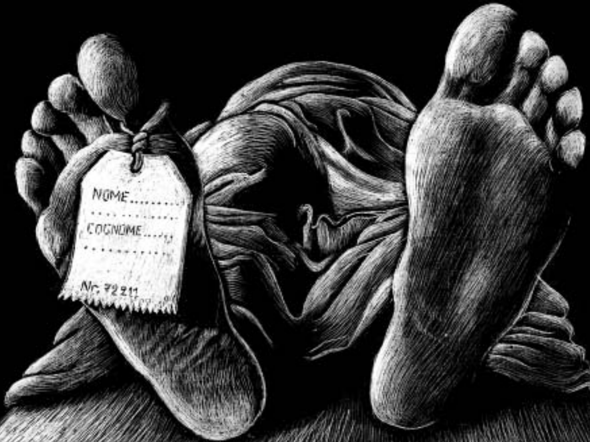
disegno di Marco Russo